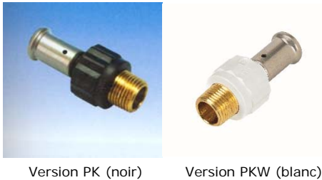
Figure 3 - Raccords à sertir en PVDF « Henco Press PVDF »

Ces raccords (voir figure 3 ), sont de conception identique à celle des raccords à sertir métalliques définis au paragraphe 3.121.