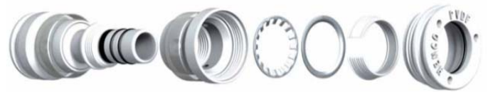
Figure 4 - Raccord instantané « Henco Vision »