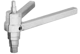
Produit allemand de qualité