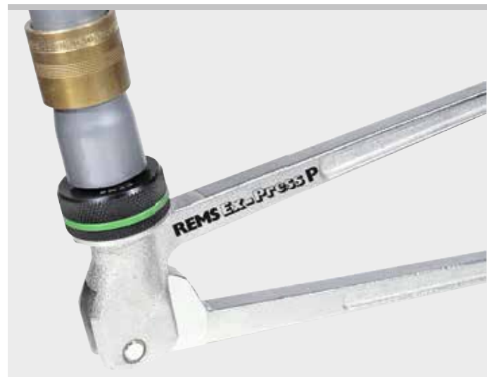
Produit allemand de qualité