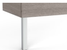
Jeu de 2 pieds (en option)