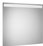
Miroir avec lampe à LED intégrée