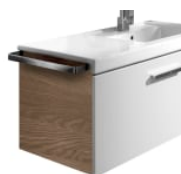
Porte-serviettes pour meuble