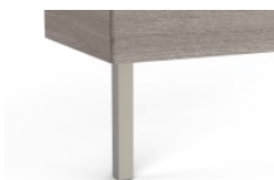
Jeu de 2 pieds (en option)