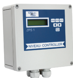
Coffret de commande ZPS 1