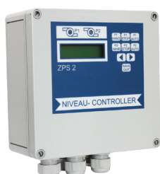
Coffret de commande ZPS 2