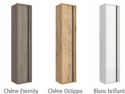
Chêne Eternity Chêne Ostippo Blanc brillant